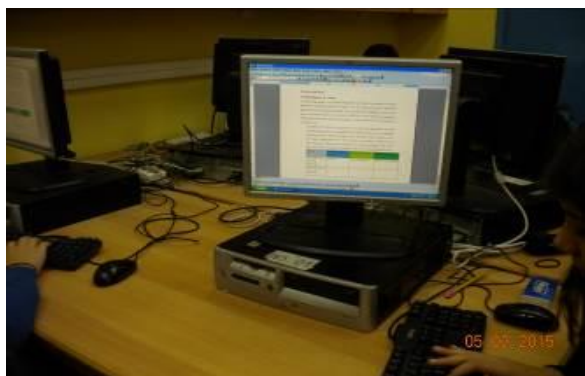
Εικόνα 1: Συμπλήρωση 1ου φύλλου εργασίας

Στο παρόν σενάριο επιλέχθηκαν να αναλυθούν δύο ειδήσεις σχετικές με την ταυτότητα της παιδικής ηλικίας. Η πρώτη ήταν αυτή του φόνου που διέπραξε 13χρονος στο Αγρίνιο στις 22/05/2013 και η δεύτερη η δολοφονία του Αλέξη Γρηγορόπουλου στις 6/12/2008 στα Εξάρχεια. Πρόκειται για δύο αντίθετες περιπτώσεις, δεδομένου ότι στην πρώτη ο θύτης είναι παιδί και το θύμα ενήλικας, ενώ στη δεύτερη το αντίστροφο. Και οι δύο όμως έχουν ένα κοινό στοιχείο: φέρνουν στην επιφάνεια την έννοια της 'παραβατικότητας' στην παιδική ηλικία και, ταυτόχρονα, ενισχύουν τη θεωρία περί αθωότητας των παιδιών. Με λίγα λόγια τα δύο περιστατικά δημιούργησαν στην κοινή γνώμη έναν ηθικό πανικό, προερχόμενο από μια «καθολική αλήθεια» ότι τα «κανονικά» παιδιά είναι αγνά και είναι αδύνατον να προβούν σε βίαιες πράξεις. Επομένως, τα παιδιά-εγκληματίες βρίσκονται έξω από αυτή την προγραμματισμένη ηθική των φυσιολογικών, απειλούν και απειλούνται, είναι επικίνδυνα και ταυτόχρονα βρίσκονται σε κίνδυνο. Την ίδια ώρα η παιδική εγκληματικότητα εκλαμβάνεται και ως δυσλειτουργία της οικογένειας, με αποτέλεσμα να κατηγορούνται και οι γονείς για τις βίαιες πράξεις των παιδιών τους. Τα παιδιά γνώριζαν τη δεύτερη είδηση περί της δολοφονίας του Αλέξη Γρηγορόπουλου, ενώ αγνοούσαν την πρώτη.