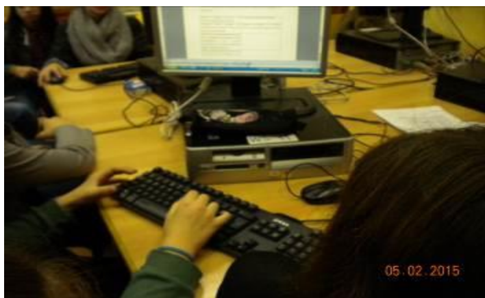
Εικόνα 2: Συμπλήρωση 2ου φύλλου εργασίας

Με το 2 ο Φύλλο Εργασίας τα παιδιά προσπάθησαν να φέρουν στην επιφάνεια το κοινωνικό πλαίσιο στο οποίο εντάσσονται οι παραπάνω τίτλοι, δηλαδή τα ίδια τα παιδιά ανακάλυψαν τα χαρακτηριστικά της ταυτότητας της παιδικής ηλικίας, μιας ταυτότητας προσδιορισμένης από τους ενήλικες. Ταυτόχρονα έγινε προσπάθεια να αναδειχθεί ο κοινωνικός περίγυρος ως σημαντικός παράγοντας διαμόρφωσης συμπεριφορών.